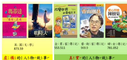
英、國、文、學、 873.59 虛、構、的、人、物、故、事、 金、家、傳、記、 藝、術、家、傳、記、 婦、女、傳、記、 553.511 909.9 781.052 真、實、的、人、物、故、事、