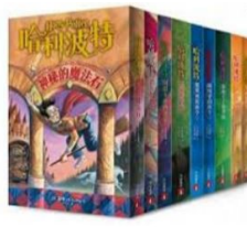
800類(語、言、文、學、類)書、籍